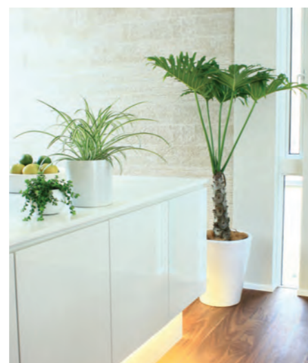
写真左：ペペロミアイザベラ(小鉢) 中：35. オリヅルラン(小鉢) 右：36. セローム(大鉢)