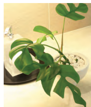
写真中・手前: アスパラガス スプレングレー (小鉢) 写真下: モンステラ (小鉢)