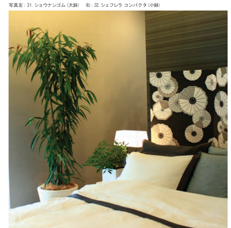
写真左: 31. ショウナンゴム (大鉢) 右: 32. シェフレラ コンパクト (小鉢)

● 光の量 ☀️ 多め ☀️ 適量 ☀️ 少なめ ● 水やり 💧 多め 💧 適量 💧 少なめ ● 温度 🌡️ 10℃以上 🌡️ 5℃~10℃ 🌡️ 1℃以上