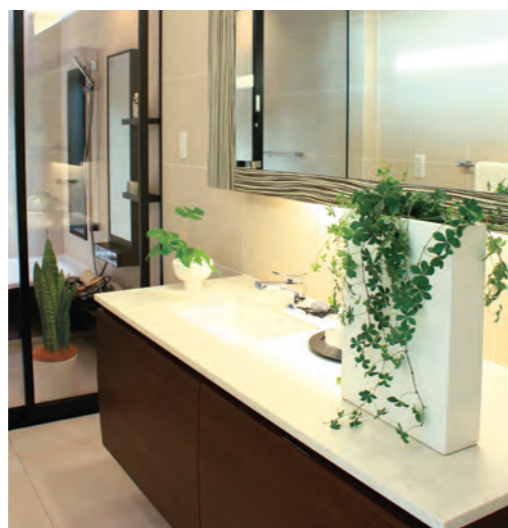
写真左：サンセベリア(中鉢) 中：モンステラ(小鉢) 右：34. シュガーバイン(小鉢)