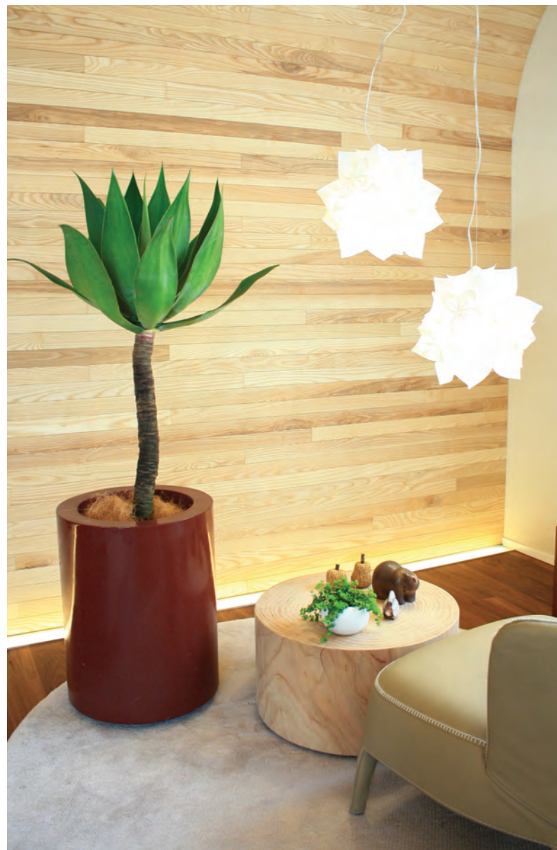
写真上・左: 29. アガベ (中鉢) 右: 30. ベベロミア イザベラ (小鉢)