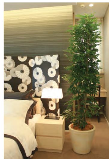
写真：33. シマトネリコ(大鉢)